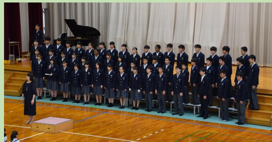
学習発表会 Learning recital