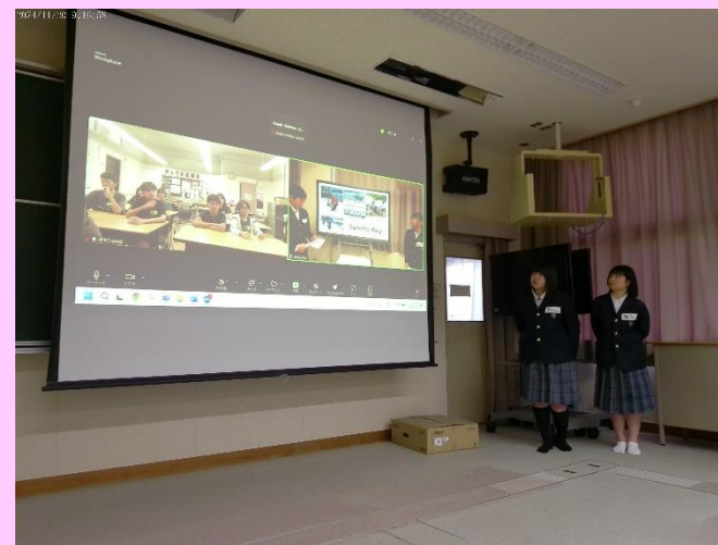
オンラインで、ワシントンミドルスクールの友達と話をしています。 Online, students talk with their friends at Washington Middle School.