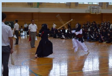
剣道部 Kendo club