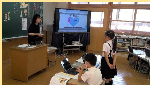
電子黒板で自分の気持ちを表現しています。 Students express our feelings on the electronic board.