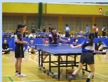
卓球部 Table tennis club