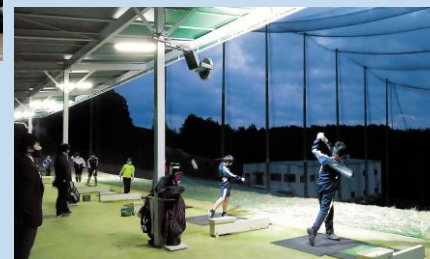
ゴルフ部 Golf club