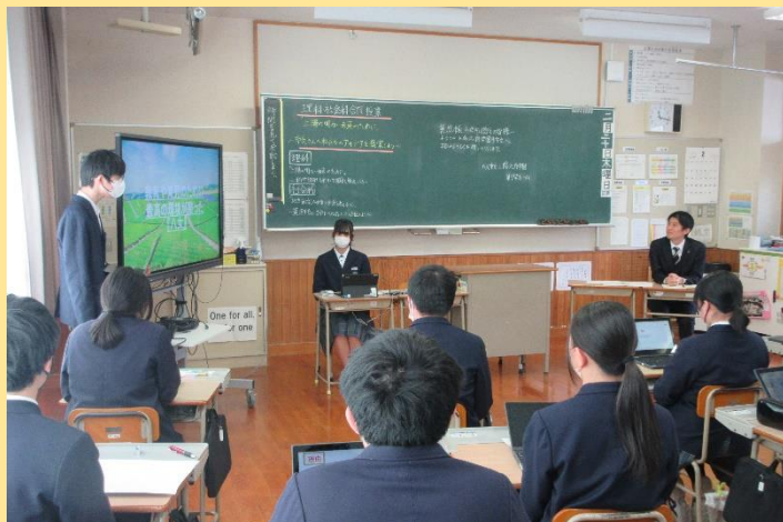
八女市長にこれからのまちづくりを提案しています。 Students are proposing future urban development to the mayor of Yame City..