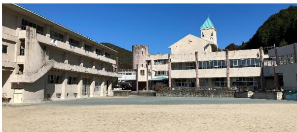
現在の上陽北納学園