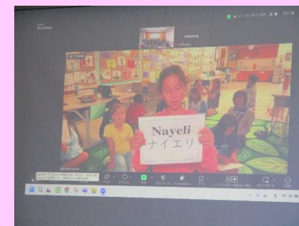
画面の中の人、ハワイの友達です。 The people on the screen are friends in Hawaii.