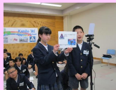
英語を使って話をしています。 Students speak in English.