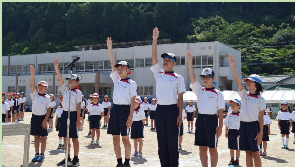
運動会 Sports day