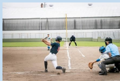
野球部 Baseball club