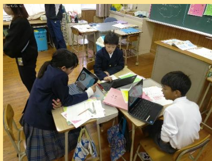
日常的にタブレットを使用しています。 Students use tablets on a daily basis in class.