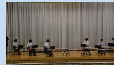
音楽部 Music club